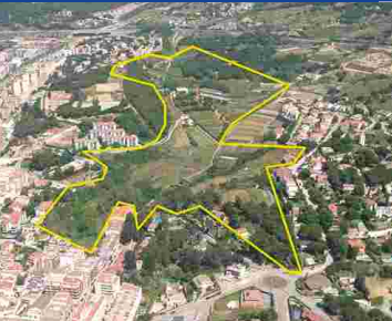
El Bareu ahir