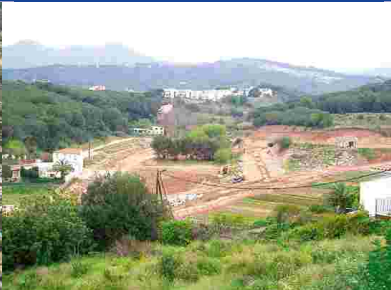
El Bareu avui