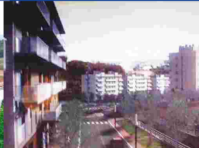
El Bareu demà

10,5 hectàrees de terreny urbà Més de 400 nous habitatges Nomès 60 habitatges protegits Prop de 1.200 nous habitants